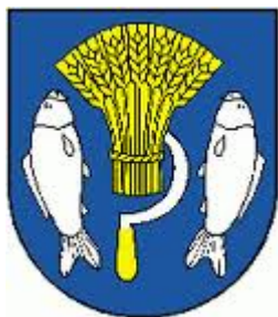
Erb obce :